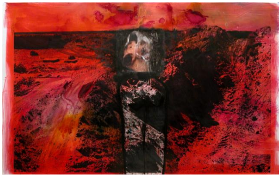
Huma Bhabha, Red Desert , 2010

WWW . DESTE . GR T — 30 210 27 58 490 F — 30 210 27 54 862